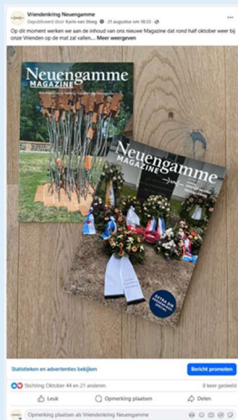
Een van onze berichten op Facebook

In oktober 2025 komt het nieuwe Magazine uit. Rond 10 oktober zal deze bij u op de mat liggen. Op de website kunt u altijd de laatste twee Magazines in pdf terugvinden. Mocht u oudere Magazines in pdf willen ontvangen, dan kunt u dit opvragen bij het secretariaat.