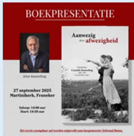
Het boek “Aanwezig door afwezigheid”

Leek me mooi om jullie te melden. Het is namelijk voor de families erg mooi dat er nu een gedenkplek is.”