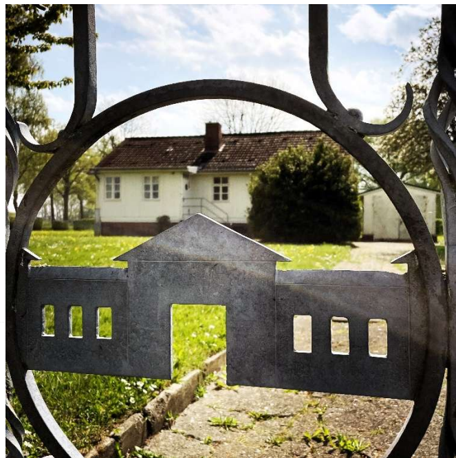
Huis van de kampcommandant Neuengamme