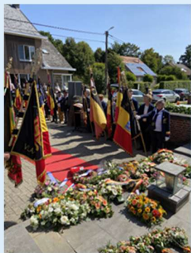
Herdenking Meensel-Kiezegem, België

Hierbij ontvangt u een nieuwsbrief van Stichting Vriendenkring Neuengamme met een terugblik en informatie over de diverse activiteiten die de komende periode gaan plaatsvinden.