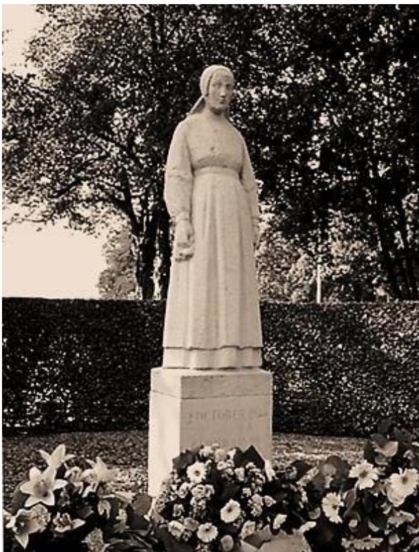
Vrouwtje van Putten Ontwerp van Marie Silvester Andriessen

De vraag is nu hoe ik bij haar kom, want ik wil haar ontmoeten. Ik neem de derde afslag op de rotonde en kijk om me heen. Plotseling zie ik een kleine parkeerplaats. Resoluut draai ik het stuur naar rechts en rijdt ernaartoe. Ik zet de auto in zijn achteruit en bemachtig een mooi plekje. Mijn klamme handen glijden even weg bij het uitstappen. Het zijn de zenuwen. Ik voel een verleden, ik ruik een verleden. Het licht is zeer fel, maar de zonnebril in het dashboardkastje vind ik onfatsoenlijk. Ik zet mijn hand horizontaal tegen het voorhoofd en kijk rond.