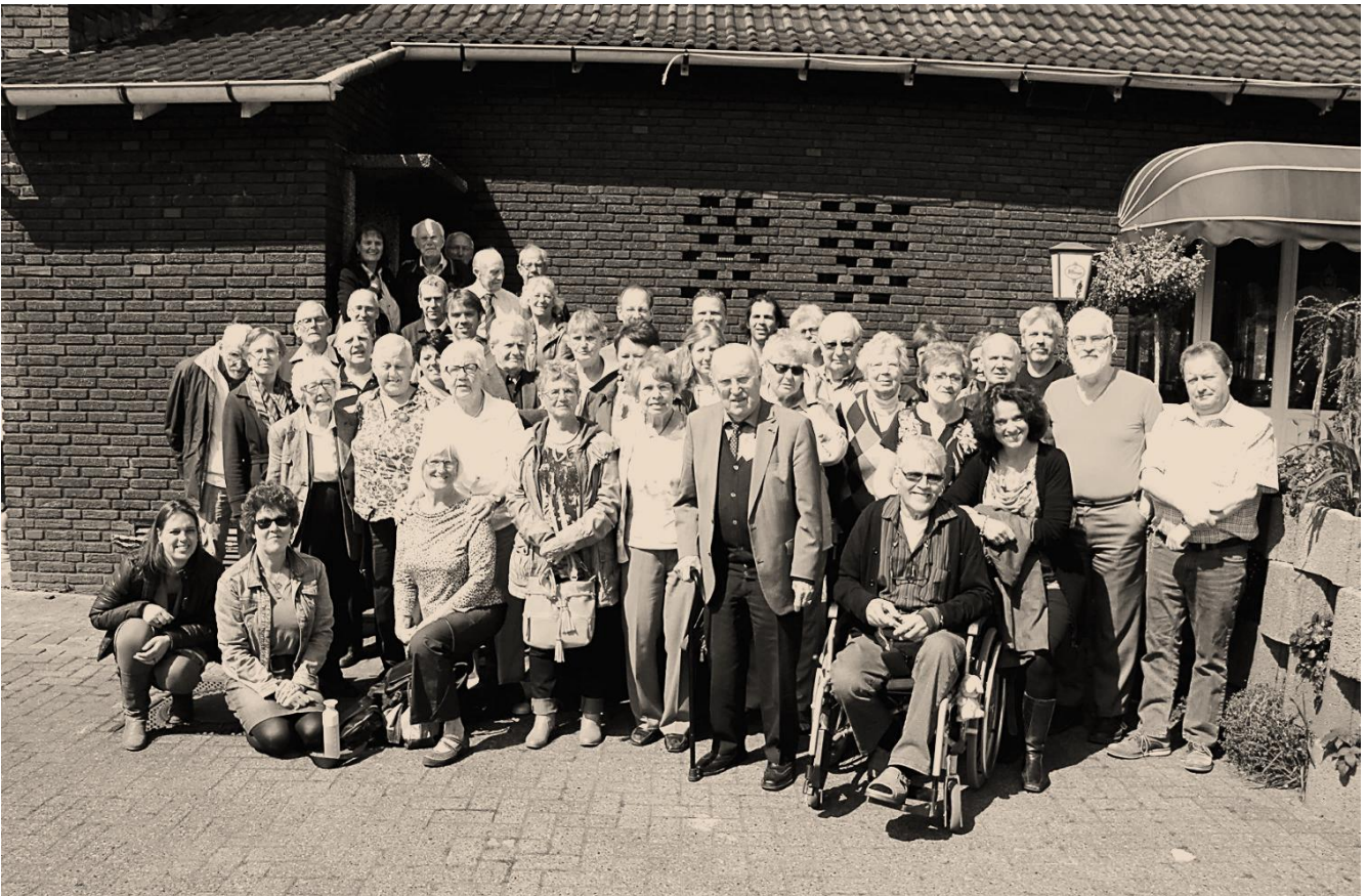
Groepsfoto van deelnemers aan deze herdenkingsreis.