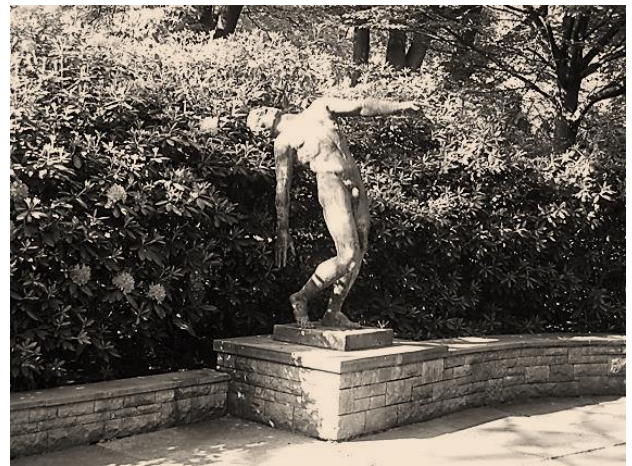
Monument 'Vallende man', een variant van beeldhouwer Cor van Kralingen

Voor het onderhouden van de vele Nederlandse oorlogsgraven in binnen- en buitenland is veel geld nodig. Hiervoor ontvangt de Oorlogsgravenstichting subsidie van het Ministerie van Binnenlandse Zaken en Koninkrijksrelaties. Door trouwe begunstigers wordt periodiek een bijdrage of gift gestort. Soms worden ook legaten en bijzondere schenkingen ontvangen.