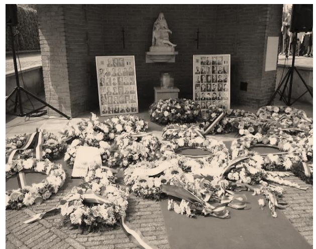
Het monument na de kranslegging.