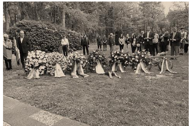
Kransen gelegd op de Kriegsgräberstätte Sandbostel.

De herdenking werd voortgezet op het voormalige kampterrein in een van de kampkeukens.